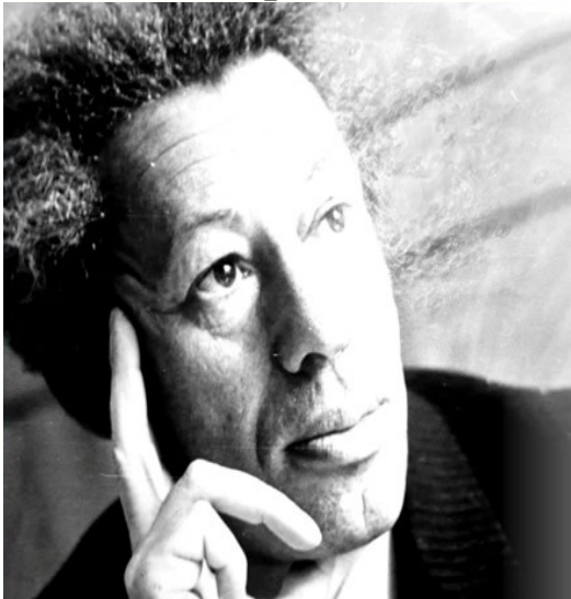
Израиль Ефремович Шварц

Ключевыми педагогическими условиями предупреждения и преодоления бродяжничества подростков являются: