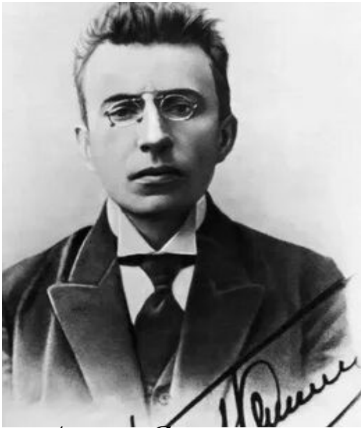
Антон Семенович Макаренко