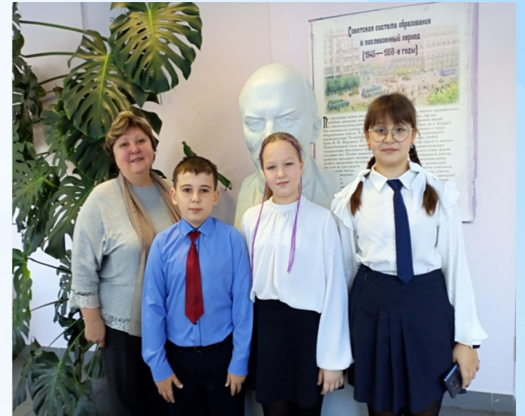
Современная система образования в послесоветский период (1945—1990-е годы)